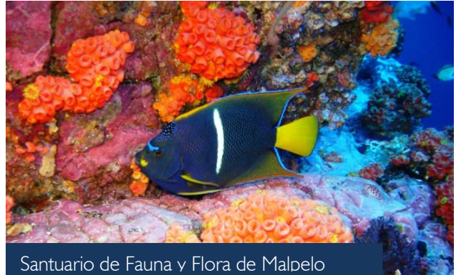
Santuario de Fauna y Flora de Malpelo