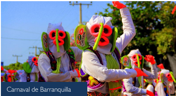
Carnaval de Barranquilla