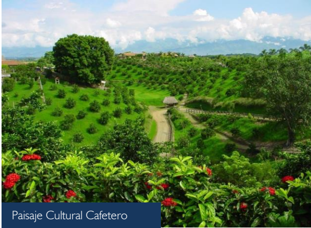
Paisaje Cultural Cafetero

Fotos de algunos de los patrimonios culturales: