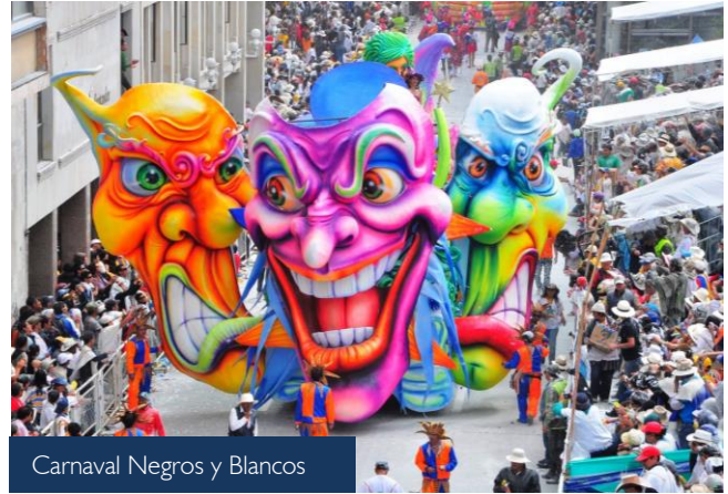
Carnaval Negros y Blancos