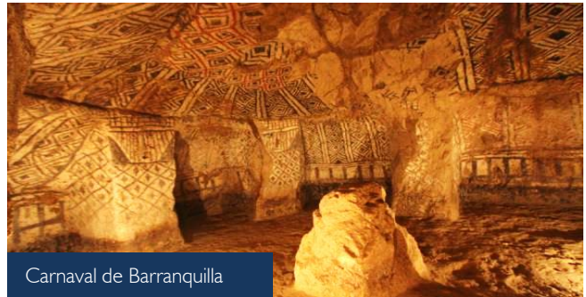
Carnaval de Barranquilla